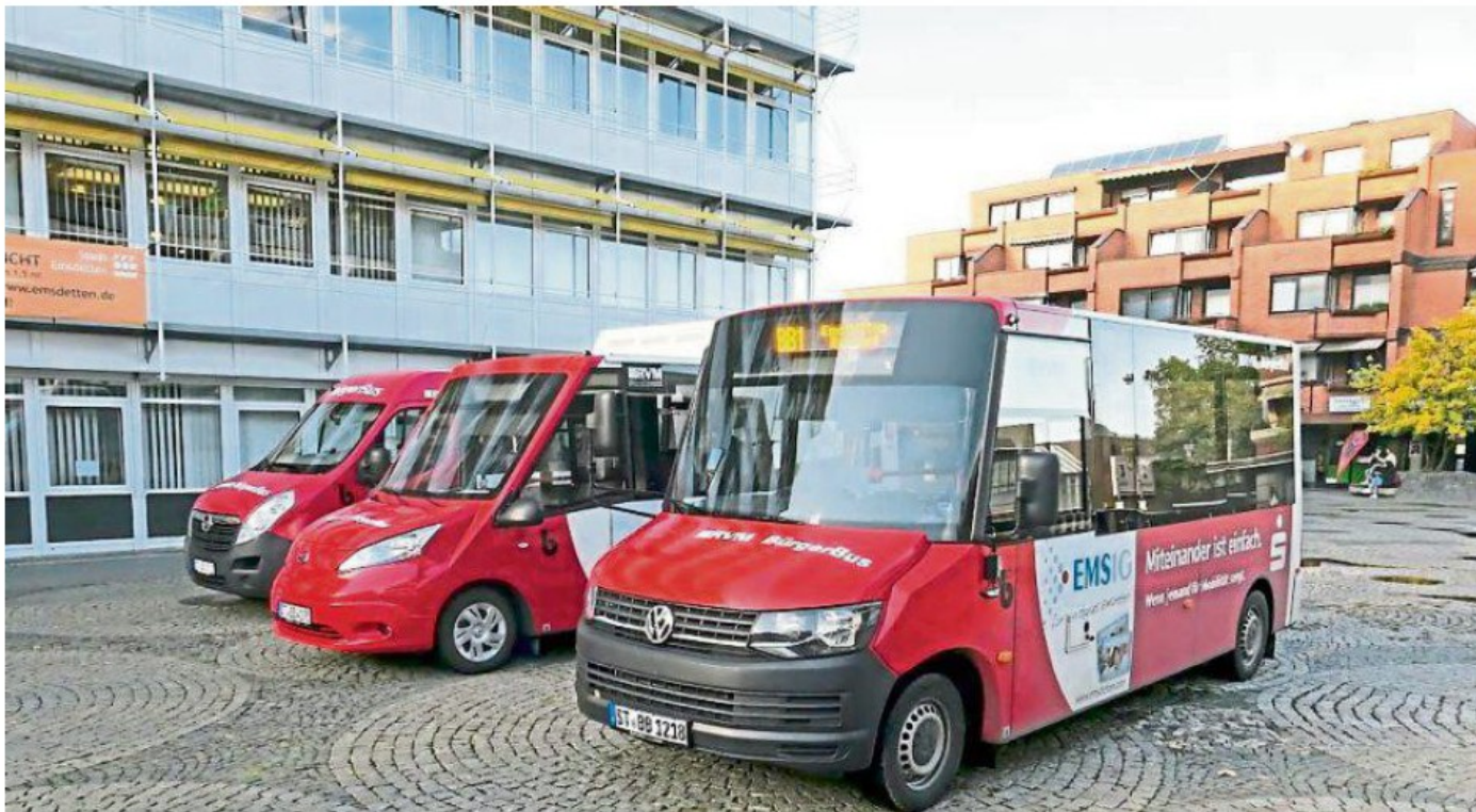
Die Bürgerbusse sind ein Erfolgsmodell. Der BB1 pendelt von Dienstag bis Sonntag und im Zwei-Stunden-Takt zwischen Saerbeck und Emsdetten.

Keine Frage: Der Bürgerbus ist ein Erfolgsmodell. Davon konnten sich jetzt die Mitglieder des Gemeinderates einmal mehr überzeugen. Willy